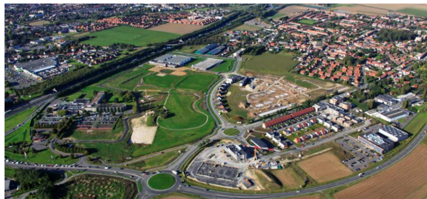
Vue aérienne du chantier