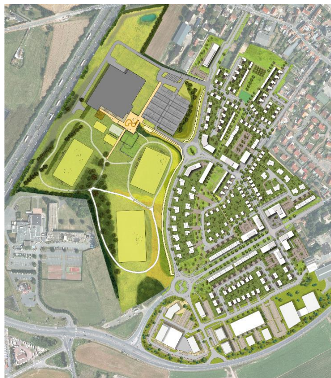
Plan masse du quartier